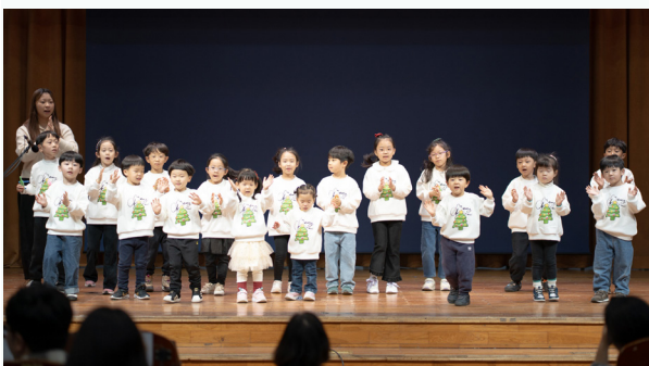
미취학부 아동들의 성탄 감사 축하 발표회.