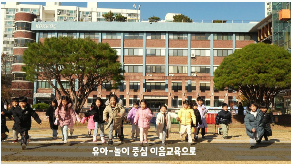
유아-놀이 중심 이음교육으로