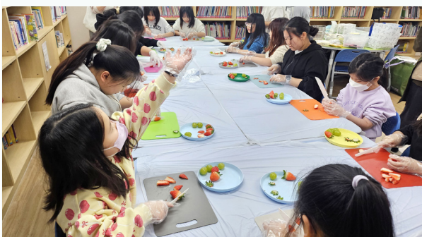
아동들이 과일을 다듬으며 케익만들기를 하고 있다.

아이들은 순서에 따라 준비한 율동과 찬양을 예쁜 목소리에 담아 선보였는데 특유의 밝고 활기찬 표정 덕분에 탄생의 기쁨이 모두에게 가득 임하는 복된 시간이 되었다. [홍성진 목사]