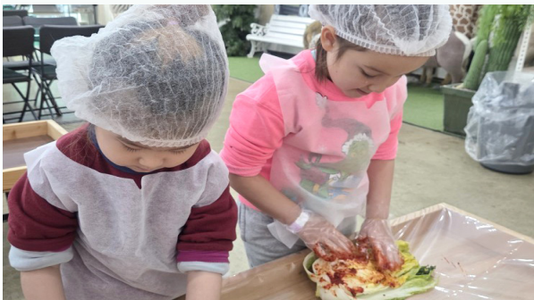
영유아들이 김장 체험을 하고 있다.

이 날 물품 전달을 넘어, 겨울철 어르신들의 식생활을 세심하게 살피는 의미 있는 시간이 됐다. 이번 활동이 대학과 지역 복지기관이 협력해 지역 내 돌봄을 실천한 사례로 돌봄과 나눔 문화 확산에 의미를 더하였다. [지역사회조직팀 이동재]