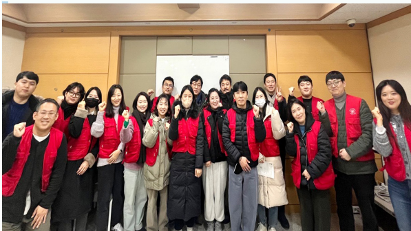
한국성서대학교 지역사회임팩트 봉사에 참여한 교직원들