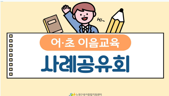
어·초 이음교육 사례공유회 안내 포스터