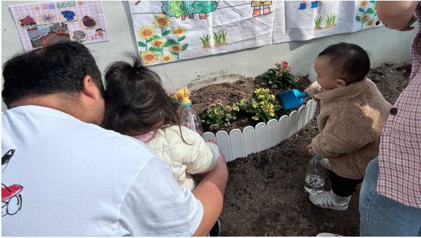
텃밭놀이에 참여한 영유아와 학부모가 작업하고 있다.