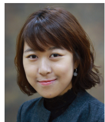
▲ 진달래 (최우수 직원)