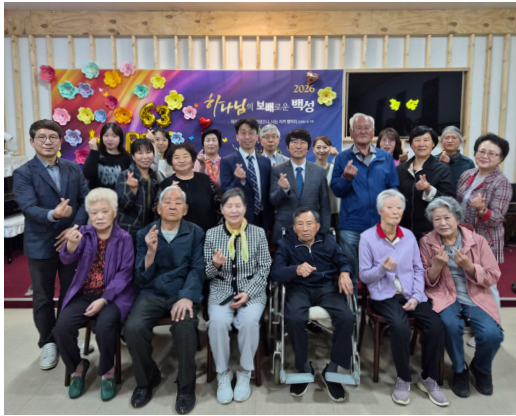
▲ 한국성서대학주일(4월26일) 예배를 다 마치고 용인성서교회 성도들이 함께 하였다.

중앙성서교회를 비롯한 한국성서선교회(이사장 현희철) 소속 11개 교회는 지난 4월 19일과 26일, 그리고 5월 10일 주일에 각각 ‘한국성서대학주일’을 지켰다. ‘한국성서대학주일’은 복음 전파의 일선에서 싸우는 형제 교회들과 복음의 싸움꾼을 양성하는 한국성서대학 간의 결집을 다짐하는 한 마당의 축제로 이루어졌다.