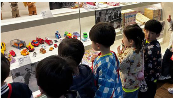
유아들이 서울생활사박물관에서 전시물을 관람하고 있다.