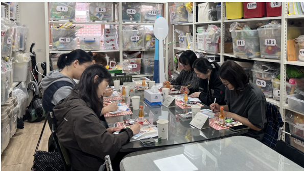
학부모들이 자신을 돌아보는 과정에 참여해 문장으로 표현하고 있다.

참여 교사들은 초등 연계의 구체적인 실천 방안과 지역 특성이 잘 반영된 사례를 통해 교육에 대한 1차 심리적 장벽을 낮추는 계기가 되었다. [송재경 보육전문요원]