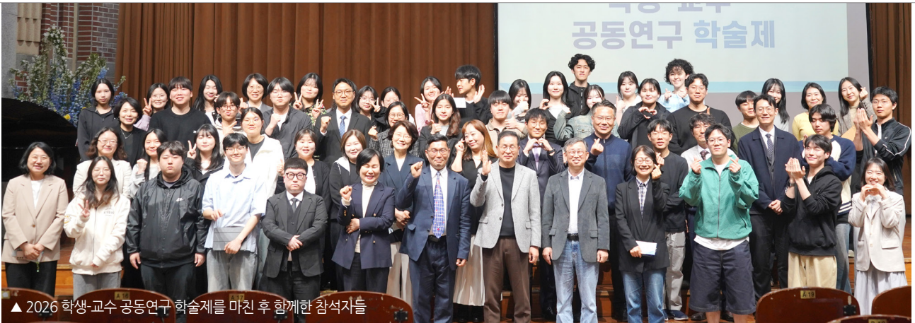
▲ 2026 학생-교수 공동연구 학술제를 마친 후 함께한 참석자들