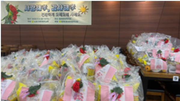
어버이날을 맞아 어른신에게 전해 줄 특식