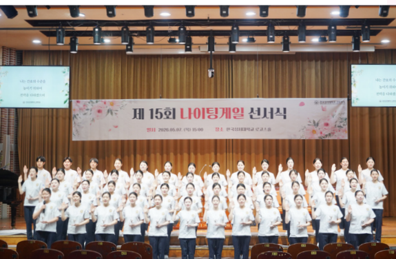
▲ 나이팅게일 선서식에 참가한 학우들이 손을 들어 선서하고 있다.