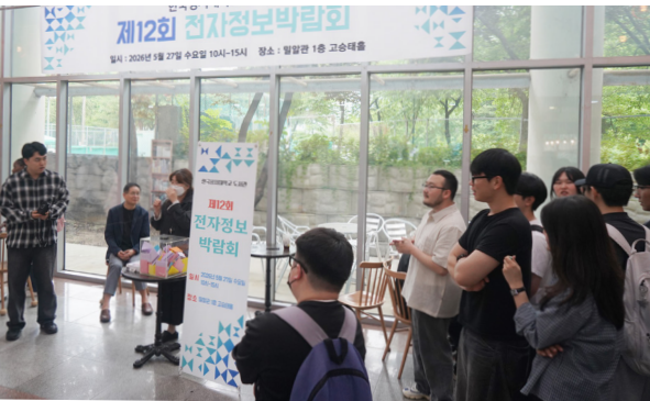
▲ 박람회 마지막 순서인 경품추첨이 진행되고 있다.

도서관이 주최한 2026 전자정보박람회가 지난 27일 밀알관 1층 고승태홀에서 개최되었다. 이 행사는 우리 대학이 구독하고 있는 전자저널과 학술DB 등의 활용법 및 구성원의 전자자료 역량 향상을 위해 진행해 오고 있다.