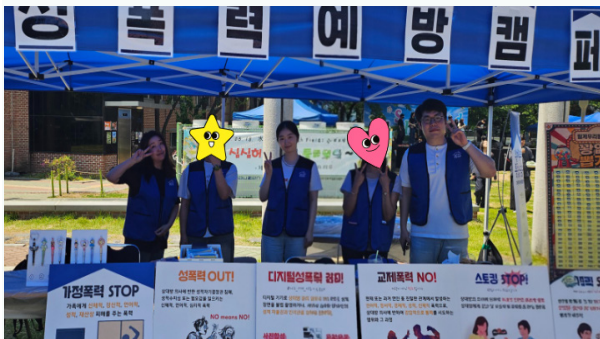
밀알축제에 참여해 성폭력 예방 캠페인을 진행 중이다.

8일 부모님께 직접 만든 카네이션과 선물로 감사의 마음을 전했고 경로당 어르신께도 카네이션을 전달, 어른 공경의 마음을 실천한 날이 되었다. [신나반 김현애 교사]