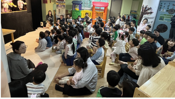
유아들이 꿈지락 인형극단의 공연을 관람하고 있다.