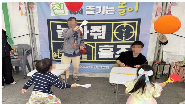
노원구 어린이날 축제에 참가해 운영한 '놀이줘 홈즈' 부스의 모습