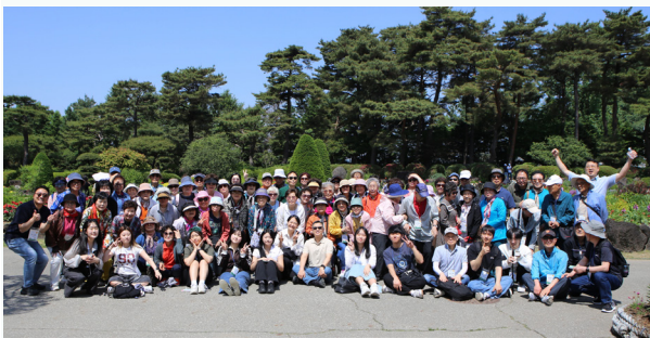
벽초지수목원에서 '청년과 함께 하는 어른신나들이' 를 마친 참가자들