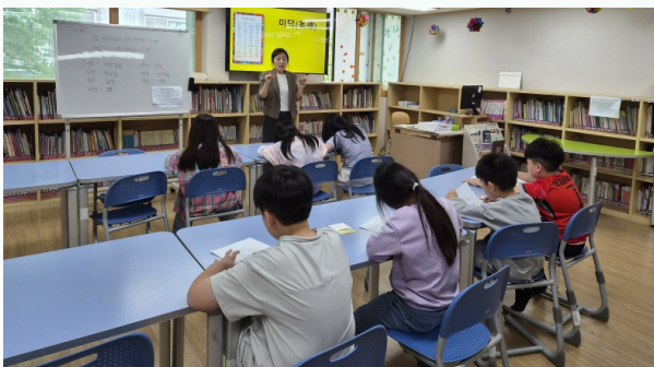
아동들이 '미덕 천사 보물 찾기' 교육을 수업하고 있다.