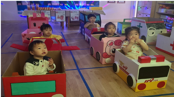
유아들이 자동차 극장에서 영화를 관람 중이다.